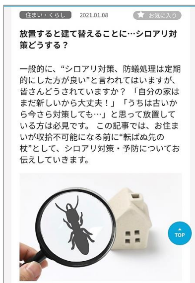
<住まい・暮らしのコラム>