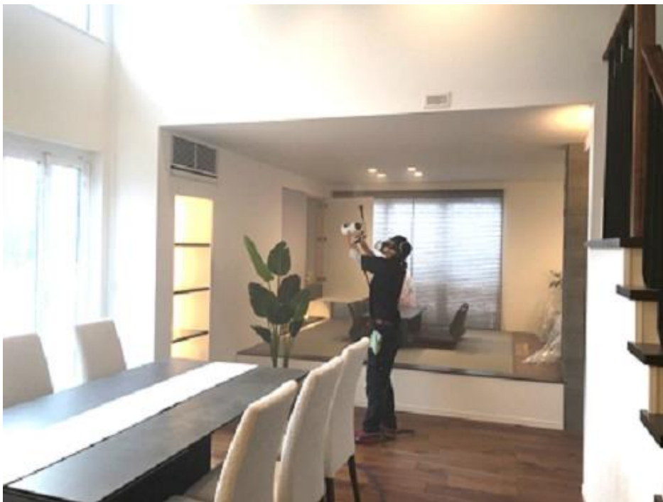
抗ウイルス抗菌コーティング(「レコナガード エアフレッシュ」) 住宅展示場への施工の様子