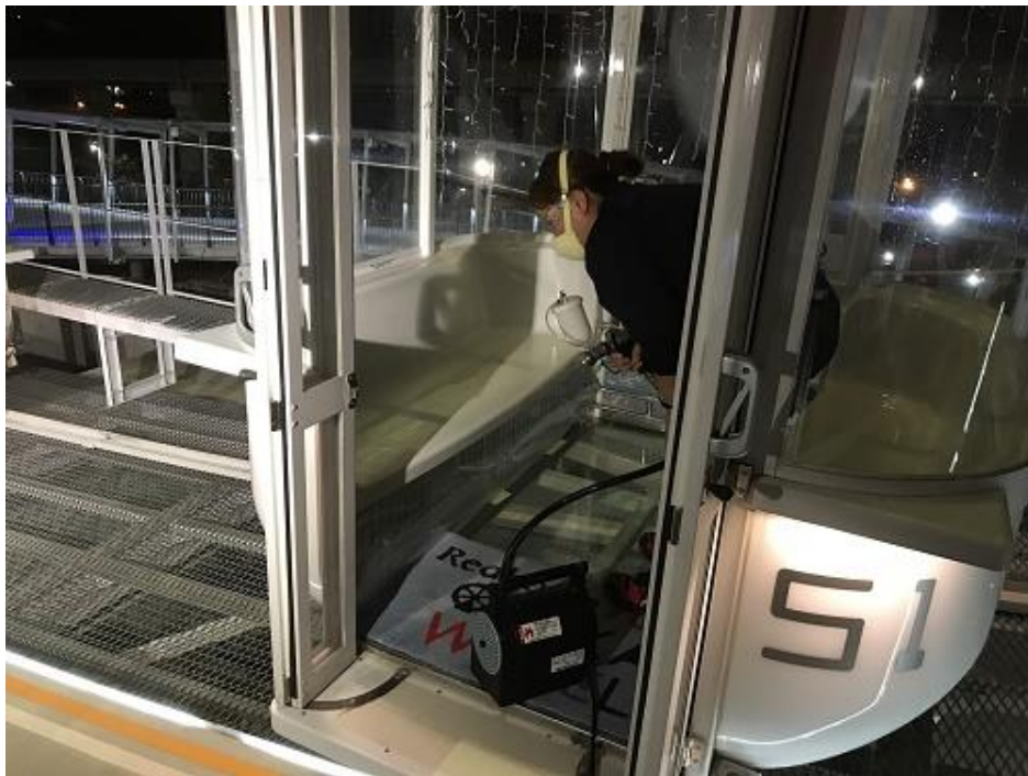
抗ウイルス抗菌コーティング(「レコナガード エアリフレッシュ」) 観覧車の施工の様子